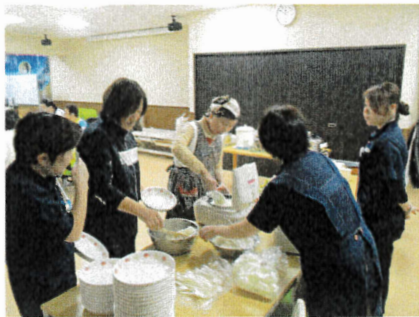
【ボランティアの 皆さんと 『はい、チーズ』】